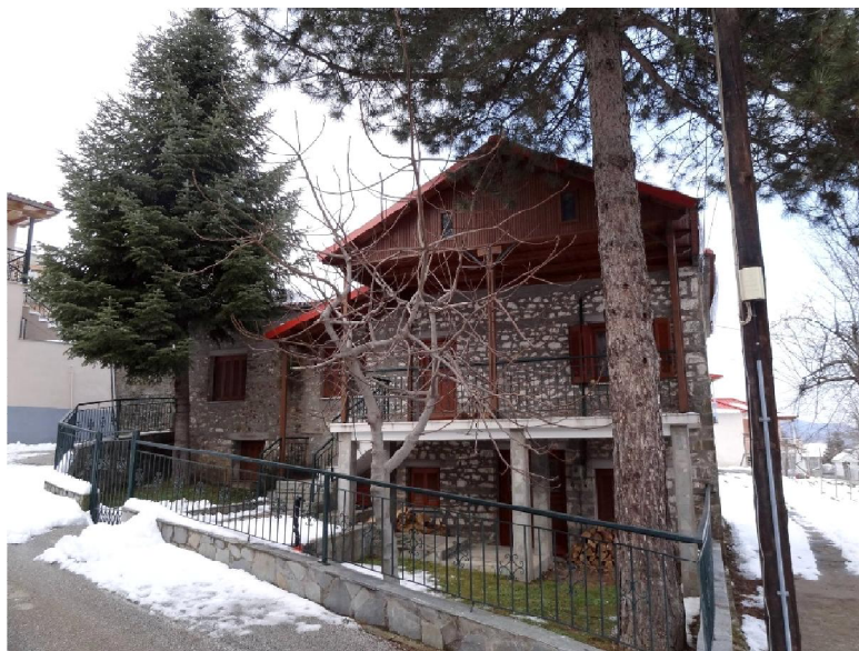
Το σημερινό σπίτι των Ζαχαροπουλαίων.