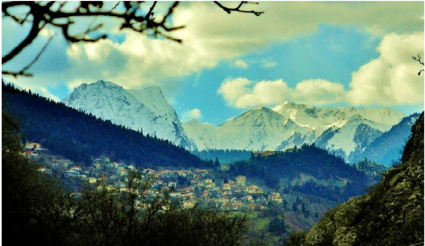
Καστανιά Αγράφων, έδρα του αρματολικιού του Γεωργίου Καραϊσκάκη.

πρόγραμμα που εφαρμόστηκε στην Ελλάδα με Κοινοτική χρηματοδότηση. Ακολούθησε ο πακτωλός των πακέτων ΝΤΕΛΟΡ, ως συνέπεια της αρχής της «οικονομικής και κοινωνικής συνοχής» που διατυπώθηκε σαφέστατα στην «Ενιαία Πράξη» η οποία τροποποίησε την Συνθήκη της Ρώμης.