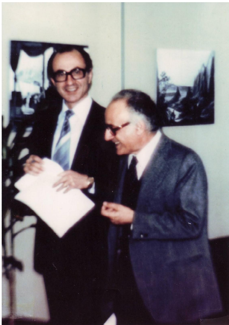
Βρυξέλλες 1977: Με τον αείμνηστο Γεώργιο Κοντογιώργη, Υπουργό για Θέματα ΕΟΚ, κατά την διάρκεια των διαπραγματεύσεων.