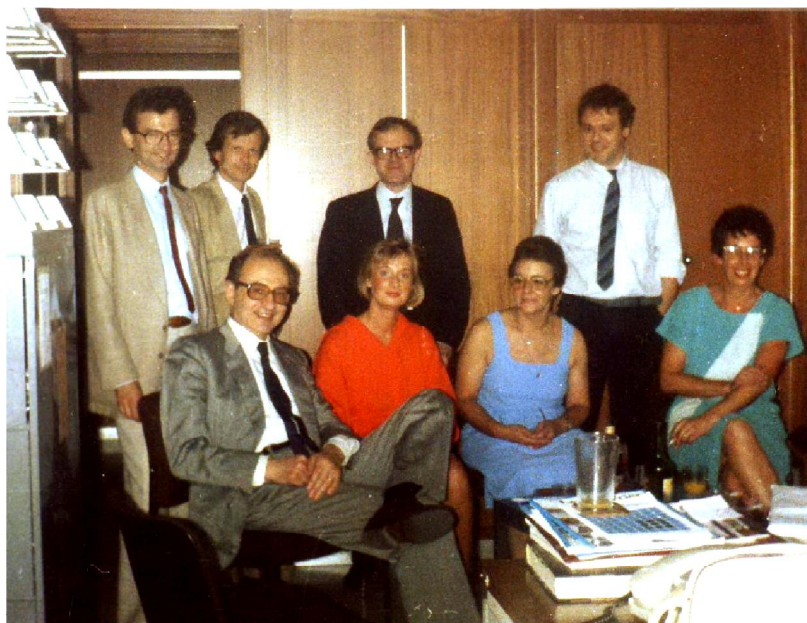
COMISSION: Με ομάδα συνεργατών.