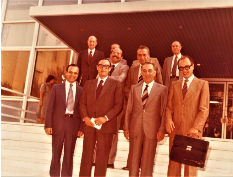
Με τον Υπουργό Γιάννη Μπούτο, Υφυπουργό, Γεν. Γραμματέα και Ανώτερα στελέχη του Υπουργείου Γεωργίας.