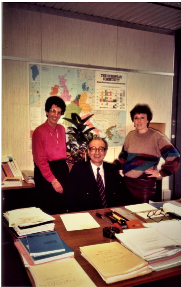
COMMISSION- Με τις γραμματείς, γαλλίδα από αριστερά και βελγίδα από δεξιά.