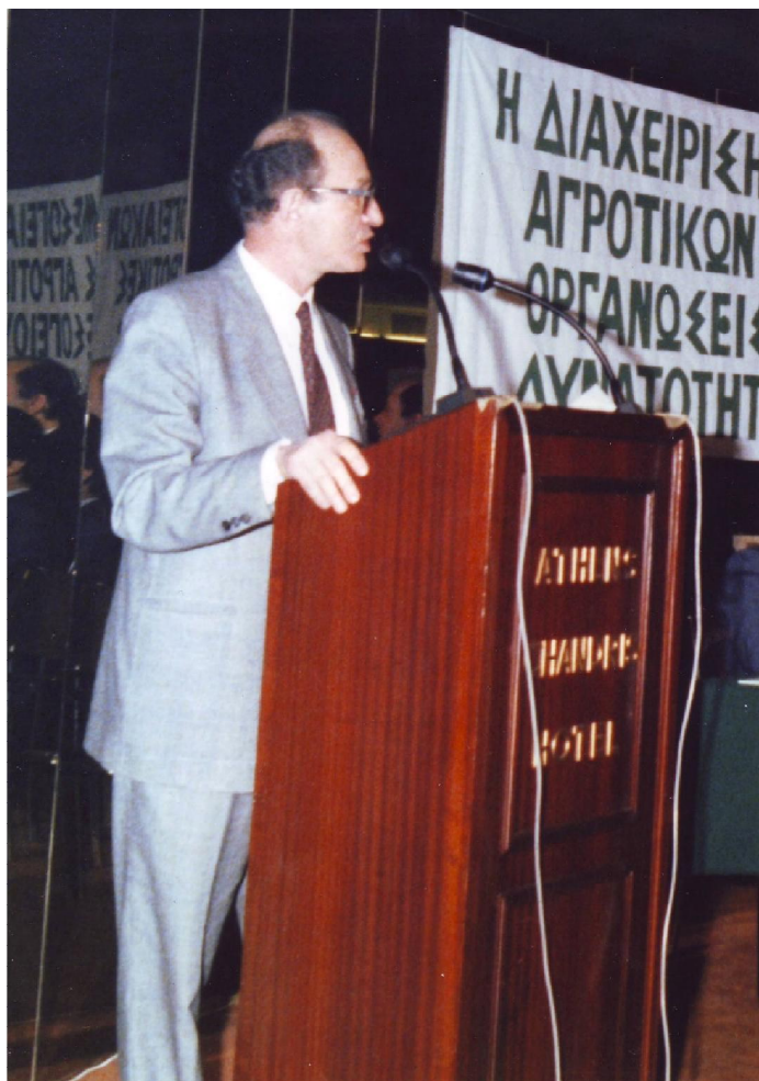
1988: Ομιλία σε συνέδριο Μεσογειακών χωρών στην Αθήνα, ως εκπρόσωπος της COMMISSION.