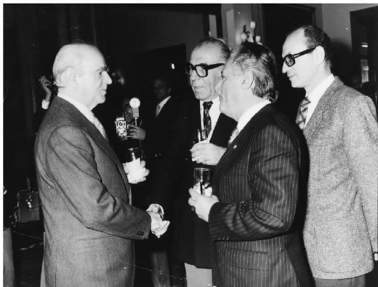
Με τον Κωνσταντίνο Καραμανλή σε εκδήλωση για την Ένταξη, την 1.1.1981.