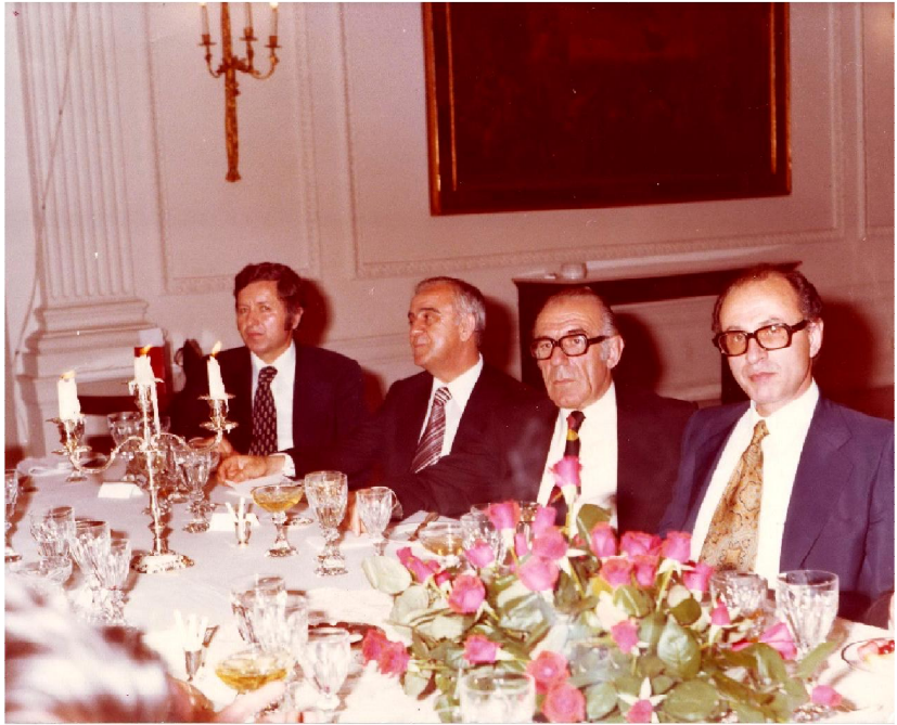
1979: Επίσημο δείπνο την ημέρα της υπογραφής της Συνθήκης ένταξης στην ΕΟΚ στο Προεδρικό Μέγαρο.