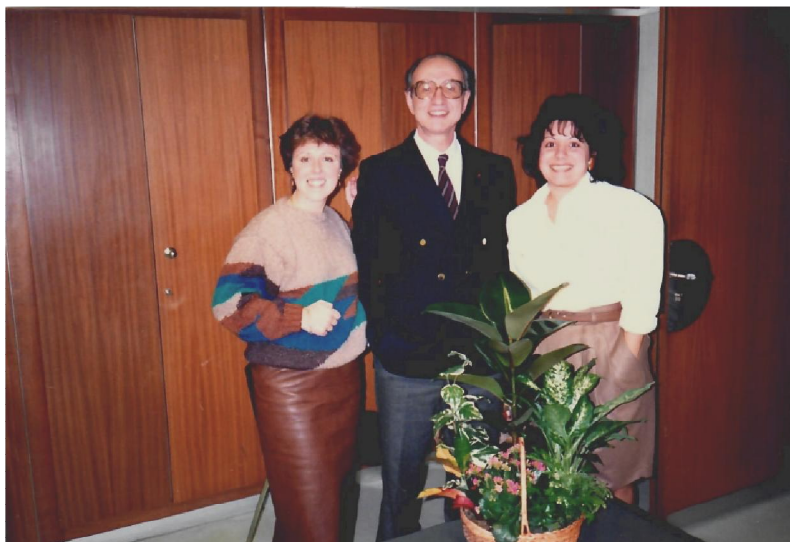
Με τις γραμματείς μου, Βελγίδα αριστερά και Ελληνίδα δεξιά.

Είναι ένα ενδιάμεσο «εκβάν» πριν από το τελευταίο, που είναι η ολοκλήρωση. Και, όπως έχει πει ο δικός μας Δημοσθένης, «προς γαρ το τελευταίον εκβάν έκαστον των πριν υπαρξάντων κρίνεται».