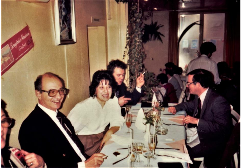
COMMISSION - Γεύμα με συνεργάτες.